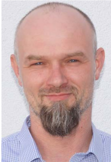
Stefan Schieritz Plusmaler GmbH, Elsnig